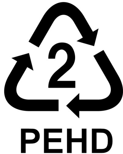
Label ou not label ? That's the question ?