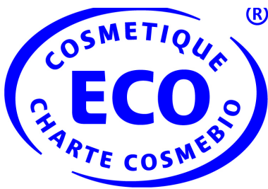
Label ou not label ? That's the question ?