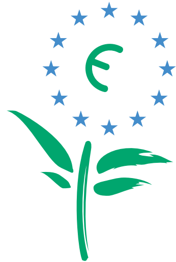
Label ou not label ? That's the question ?