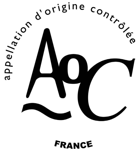
Label ou not label ? That's the question ?