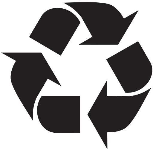
Label ou not label ? That's the question ?