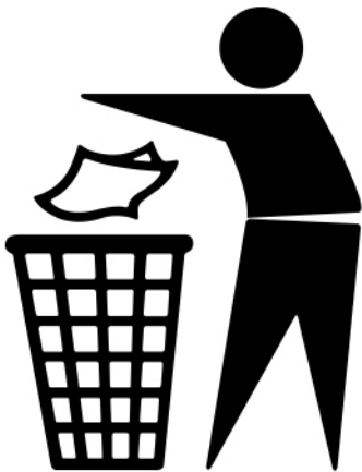
Label ou not label ? That's the question ?