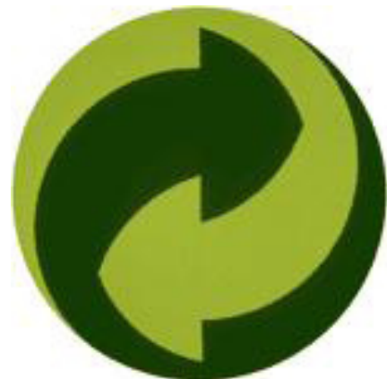
Label ou not label ? That's the question ?