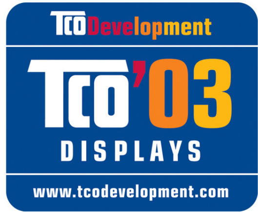
Label ou not label ? That's the question ?