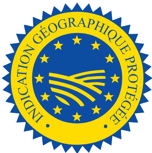
Label ou not label ? That's the question ?