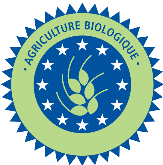
Label ou not label ? That's the question ?