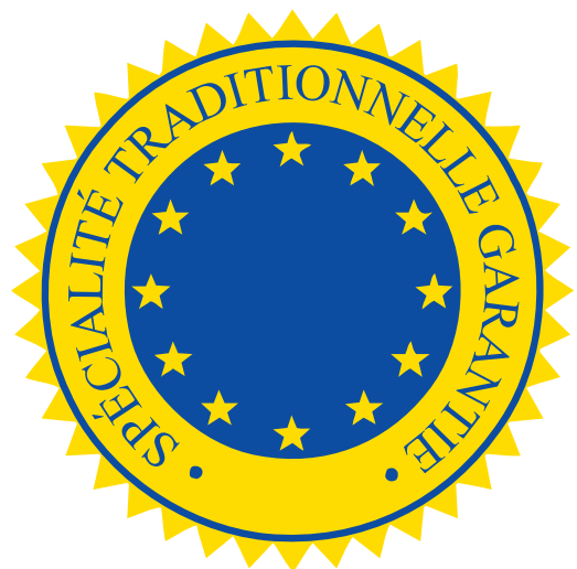
Label ou not label ? That's the question ?