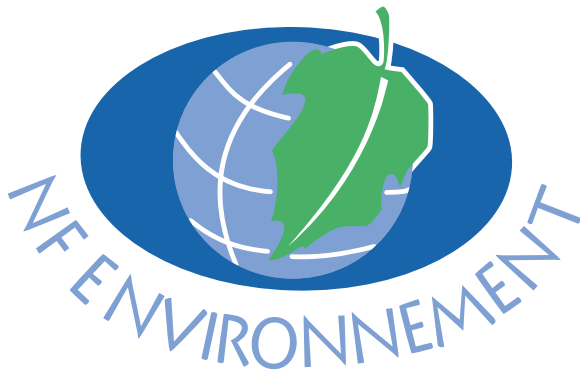
Label ou not label ? That's the question ?