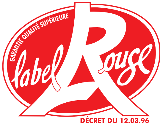
Label ou not label ? That's the question ?